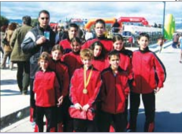
>> Els corredors que van participar al cros de Reus