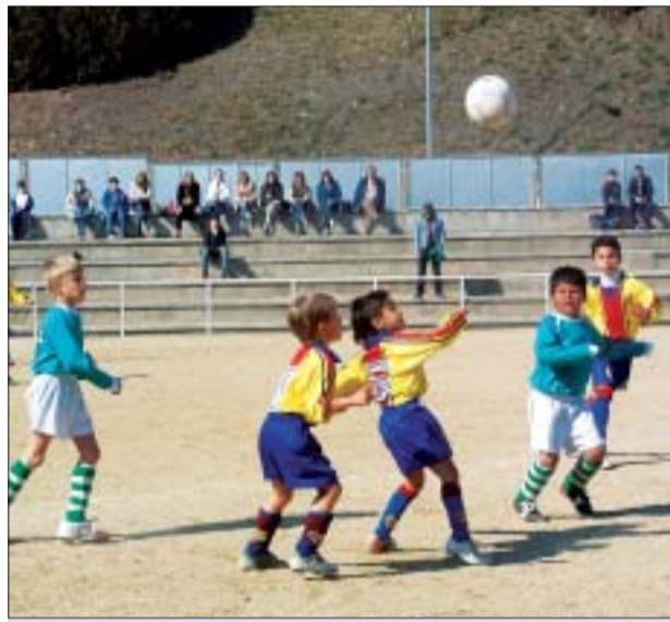
>> El Can Sant Joan va guanyar a casa al CD Cerdanyola