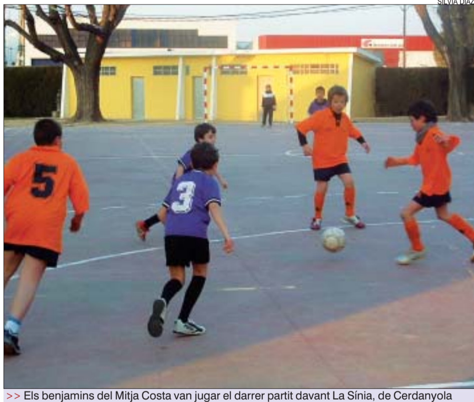
>> Els benjamins del Mitja Costa van jugar el darrer partit davant La Sínia, de Cerdanyola

En bàsquet benjamí, El Viver A, amb 11 punts, i El Turó, amb 10, juguen per aconseguir la primera posició. La resta d'equips que formen part d'aquesta lliga són el Viver B, el Sagrat Cor A, el Sagrat Cor B i els equips de Cerdanyola La Sínia A i La Sínia B. En futbol sala benjamí, el CFS Montcada-Vitelcom és líder del grup, amb 12 punts, seguit de La Sínia, amb 9. En aquest grup també hi participen el Font Freda, el Mitja Costa i El Reixac. La resta d'equips d'aquesta competició són l'AE Can Cuiàs,