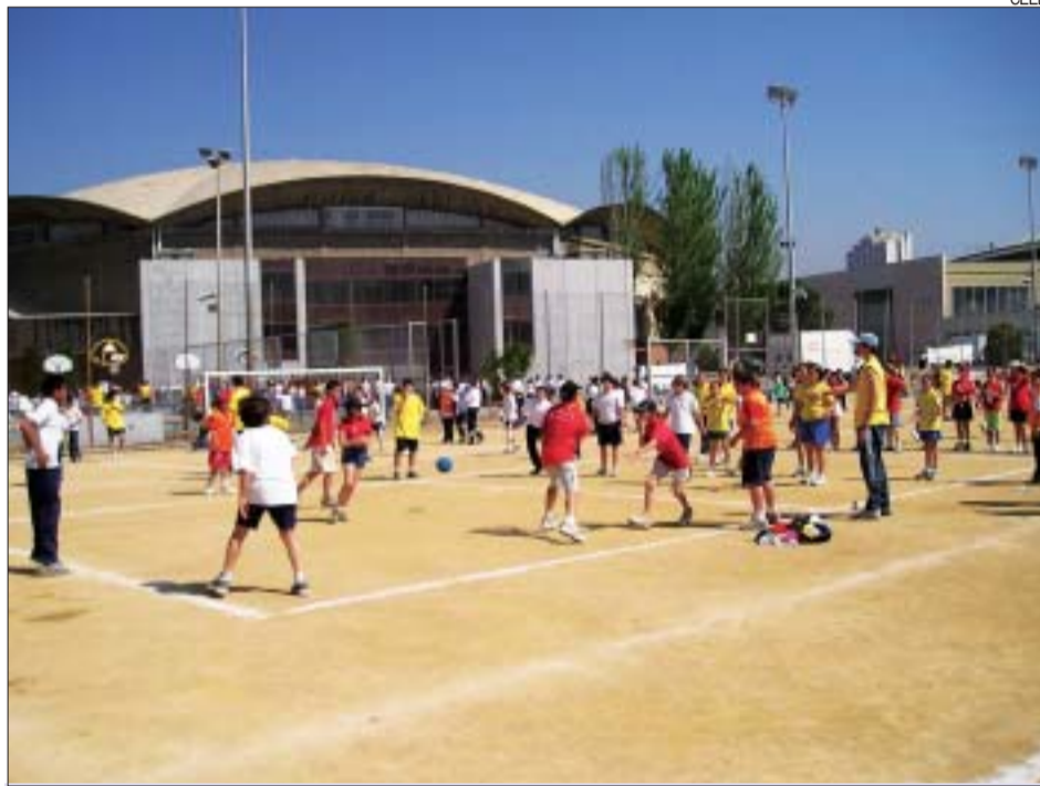
>> La trobada de l'any passat es va realitzar a les instal·lacions del FC Barcelona