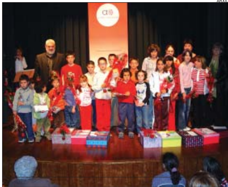
>> Els nens guanyadors del Guanya't un punt de l'edició de l'any passat

Cada autor només pot presentar un original en català, inèdit, de