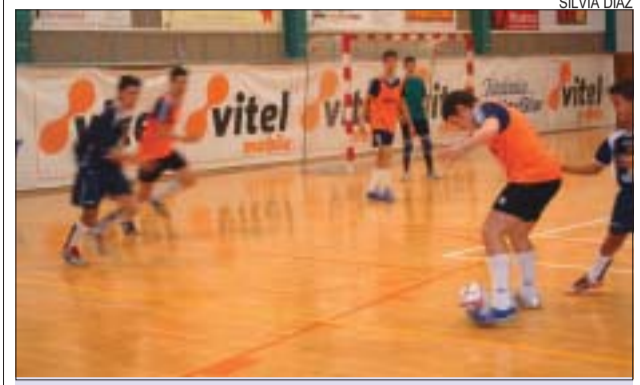
>> El cadet A jugant a casa davant el Babar