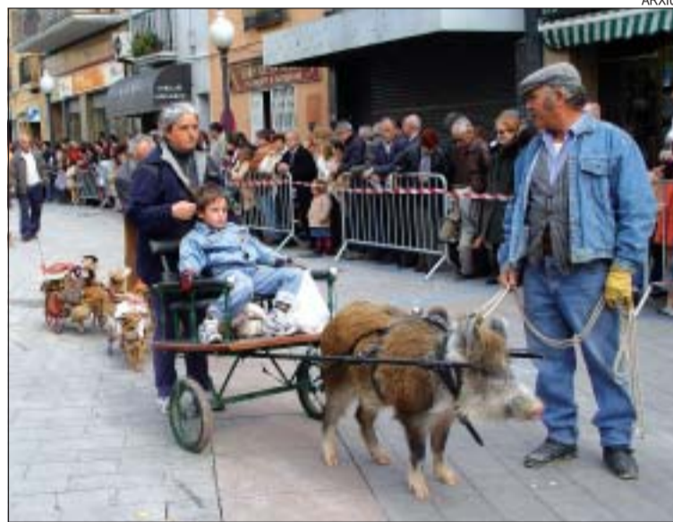
&gt;&gt; Un dels animals participants l'any passat a la desfilada