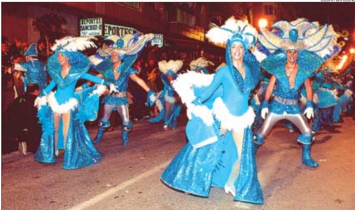
>> El grup de l'escola de dansa, en plena acció