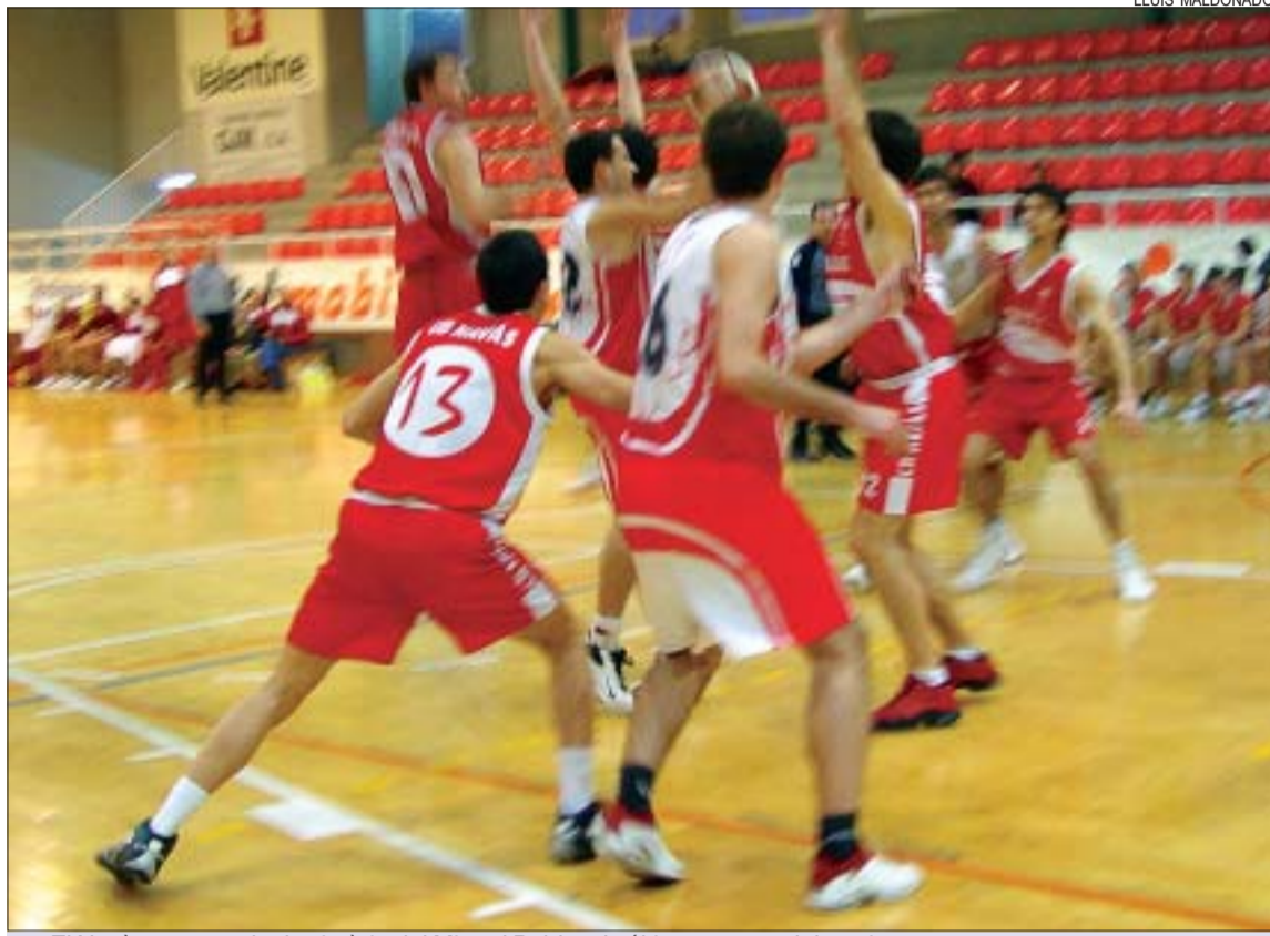
&gt;&gt; El Navàs es va endur la victòria del Miquel Poblet als últims segons del partit

El partit. El Valentine va patir a la primera part per aturar en defensa els jugadors ràpids del Navàs, que van fer 9 triples de 12 intents. A la represa, aquesta dinàmica es va corregir. El Montcada va millorar la defensa i va començar a marxar en el marcador. A manca d'un minut i mig per al final, els locals tenien