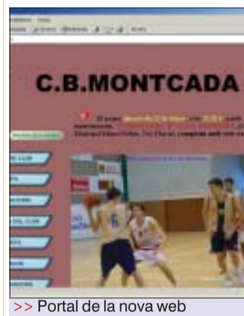
&gt;&gt; Portal de la nova web

El Club Bàsquet Montcada ha estrenat nova pàgina web, que es troba operativa des de fa un parell de setmanes amb l'adreça següent: www.cbmontcada.com . Es pot trobar tota la informació relacionada amb l'entitat: el club, els equips, les notícies, les activitats, la revista i els enllaços. La trajectòria de cada conjunt –que s'acompanya amb fotos de la plantilla i dels partits– s'actualitza cada setmana. Es poden consultar els calendaris, els resultats, les classificacions, les estadístiques acumulades i les de cada matx. “L'objectiu és que els aficionats i els socis puguin conèixer el dia a dia del club” , ha indicat el president del Bàsquet Montcada, Pere Oliva. La pàgina ha rebut ja més de 300 visites, 10 de les quals efectuades dels Estats Units, un fet que ha sorprès la mateixa junta directiva. L'anterior web de l'entitat local ha quedat inactiva. SA