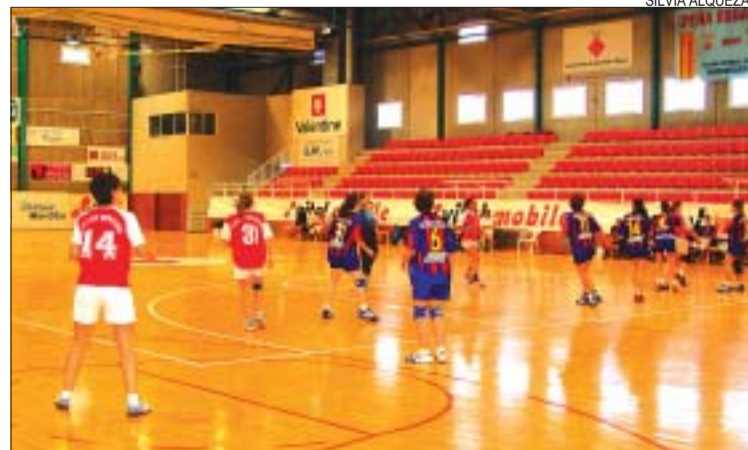
&gt;&gt; La Salle femení no guanya un partit des de principi de temporada

perança entre la plantilla. “Per fi vam portar a la pràctica el que assagem als entrenaments” , ha indicat el tècnic. Per la seva banda, el partit contra l'Agramunt que s'havia de jugar a Montcada el 20 de febrer es va ajornar a petició del rival. La Salle es troba ara a la penúltima posició de Primera Catalana amb cinc punts.