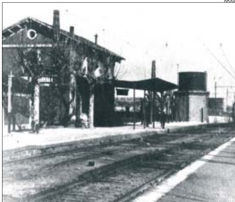
&gt;&gt; Una de les estacions ja existents a Montcada, a Mas Rampinyo

Com és evident, la nova línia sortiria de Montcada, en concret de l'estació de Mas Rampinyo (per ser Montcada un lloc travessat per tres línies diferents) i seguiria la carretera de Ribes fins a Santa Perpètua, Polinyà, Sabadell, Castellar, Sant Llorenç Savall, Gallifa, Sant Feliu de Codines, Castellterçol i Moià. Un recorregut total de 66 quilòmetres i un cost global de les obres de 5.200.000 pessetes. Salas i Argelaguet justifica la