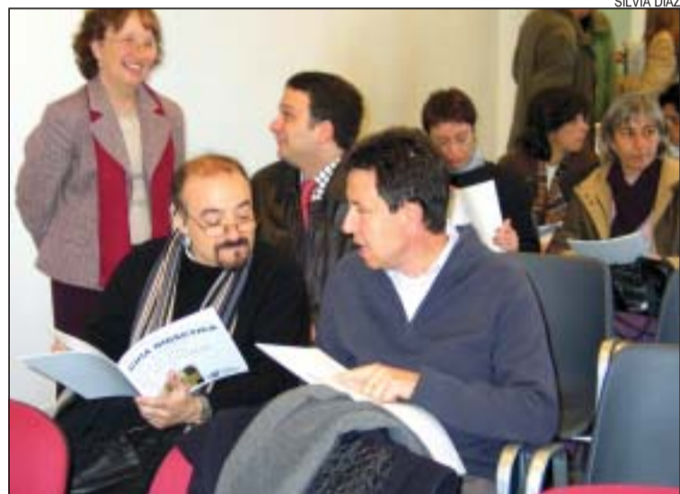
>> Una vintena de professors va assistir a la presentació de la guia