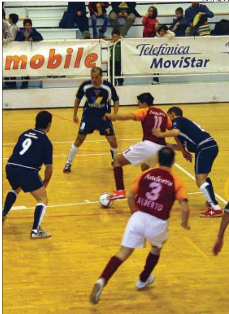
>> El Vitel va superar l'Andorra a la segona part