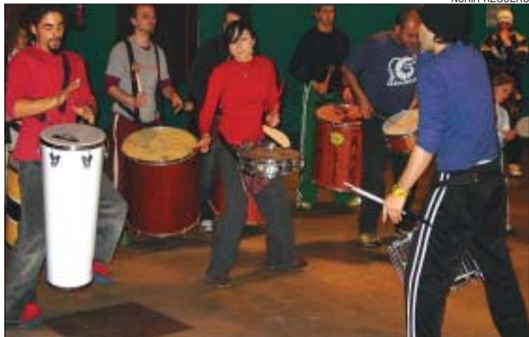
&gt;&gt; Brincadera en un dels assajos a la sala de concerts La Bàscula