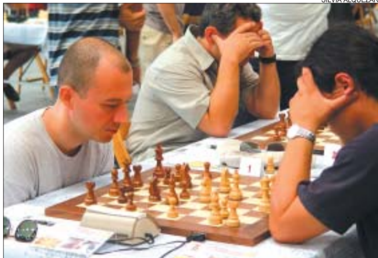
&gt;&gt; La UE Montcada ha aconseguit un resultat històric a la Copa Catalana